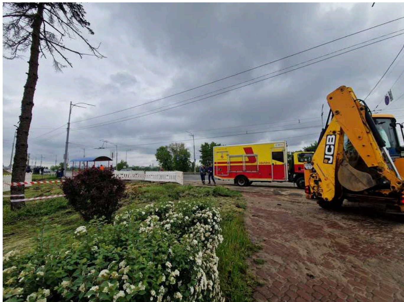
Новий супермаркет на старих мережах: як забудова добиває інфраструктуру столичних Березняків

На Березняках у Дніпровському районі Києва під час гідравлічних випробувань стався черговий масштабний прорив тепломережі - вже другий за останній тиждень, і цього разу це серйозніший. Аварія трапилась буквально за 50 метрів від скандальної забудови на вулиці Миколайчука, 3, де активісти вже давно б'ють на сполох через знищення єдиної зеленої зони мікрорайону. Для ліквідації наслідків довелося залучити додаткову аварійну бригаду з іншого району. Мешканцям Березняків та Русанівки слід готуватися до перебоїв із гарячою водою та опаленням.