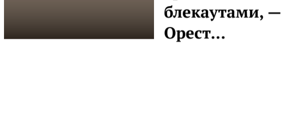
В ЄС бізнес не живе між трикутниками та блекаутами, – Орест...