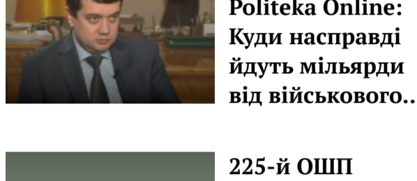
Разумков в ефірі Politeka Online: Куди насправді йдуть мільярди від військового...