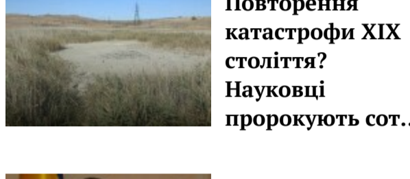
Повторення катастрофи XIX століття? Науковці пророкують сот...