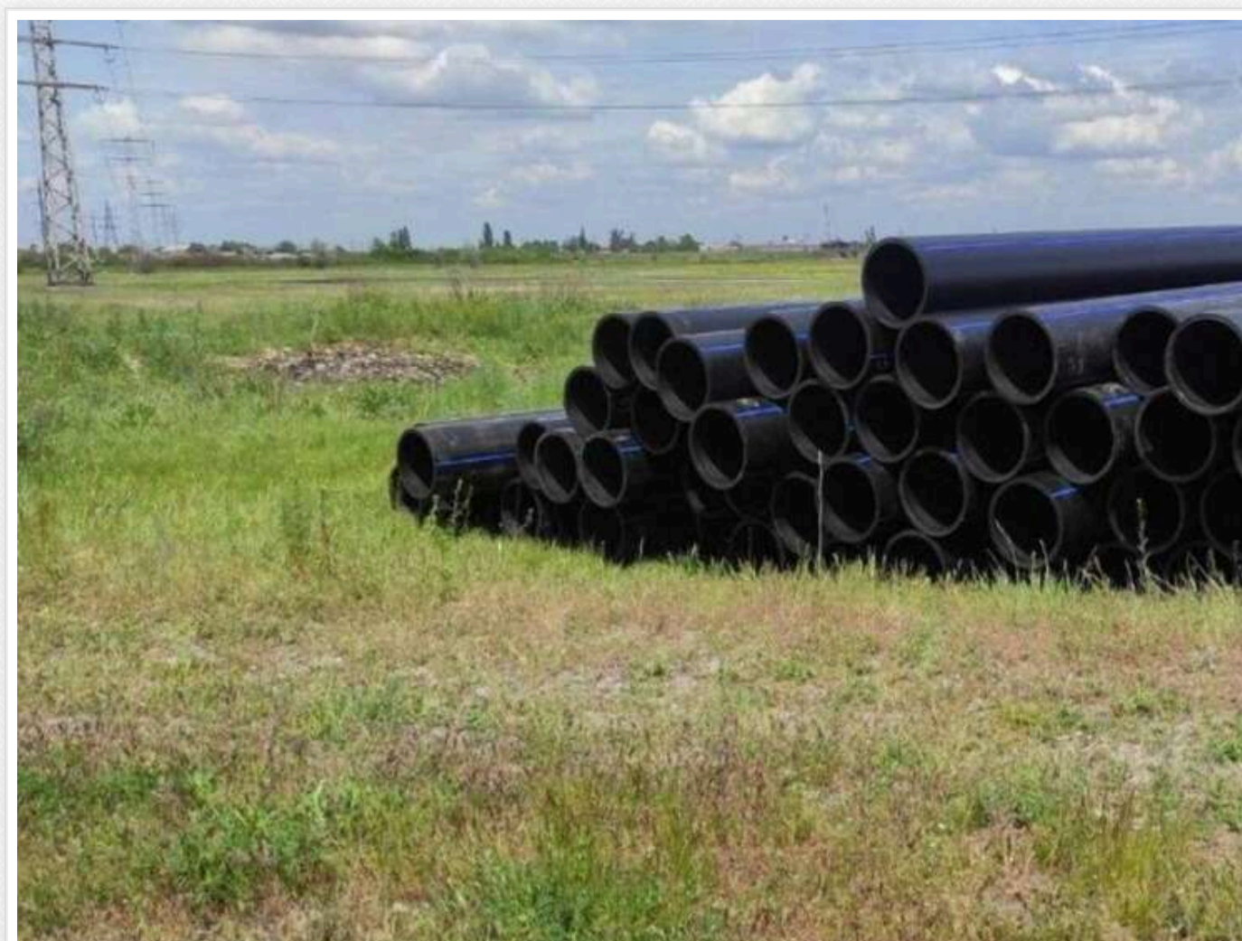
Золотий пісок Павлограда: водоканал віддав 52 мільйони єдиному учаснику тендеру із триразовим завищенням ціни

КП «Павлоградводоканал» 8 травня за результатом торгів замовило ТОВ «БК-Новострой» реконструкцію напірного каналізаційного колектора за 52,16 млн грн.