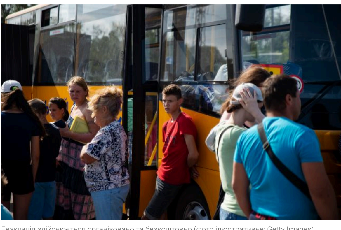
Евакуація здійснюється організовано та безкоштовно (фото ілюстративне: Getty Images)

Не витрачай час на шум! Читай тільки суть з РБК-Україна у Google