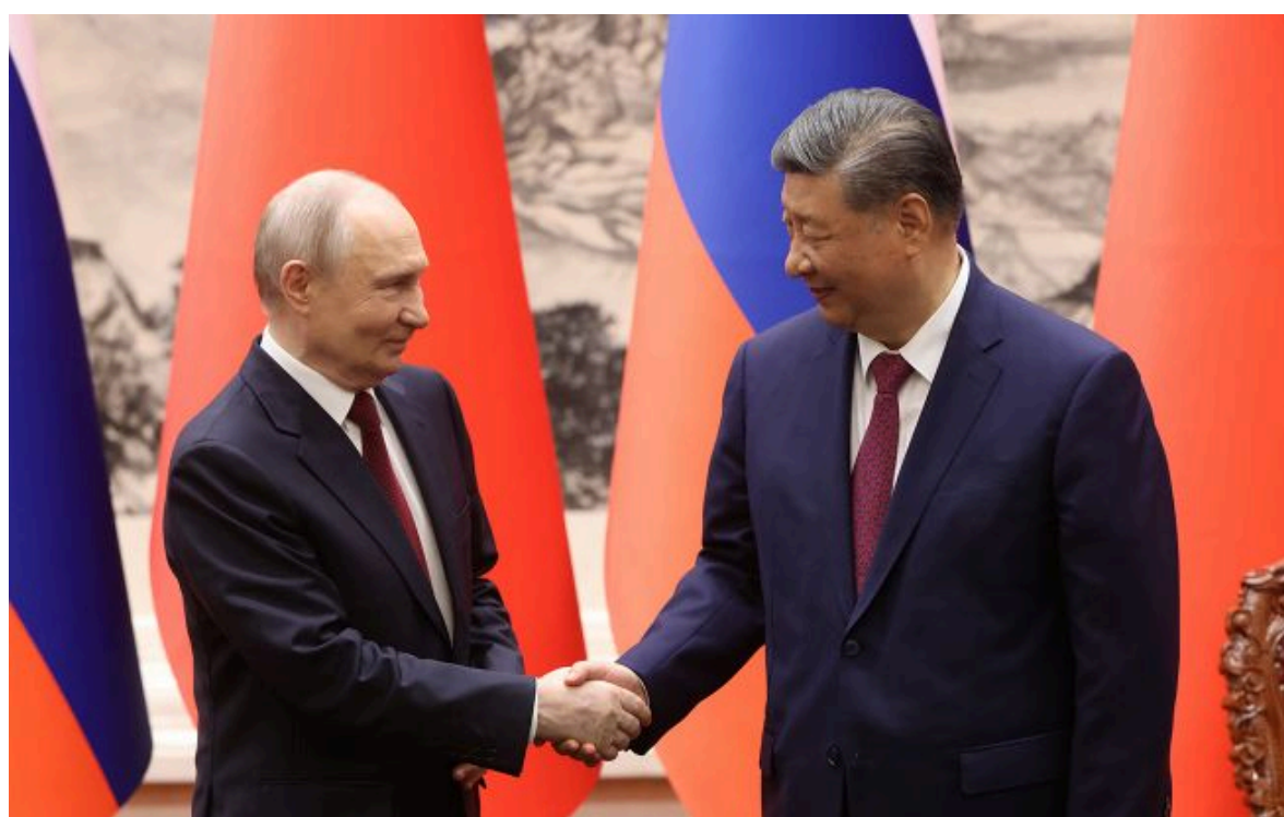
Фото: російський диктатор Володимир Путін та лідер КНР Сі Цзіньпін

Вимкни хаос міжнародних новин! Отримуй тільки важливе з РБК-Україна у Google