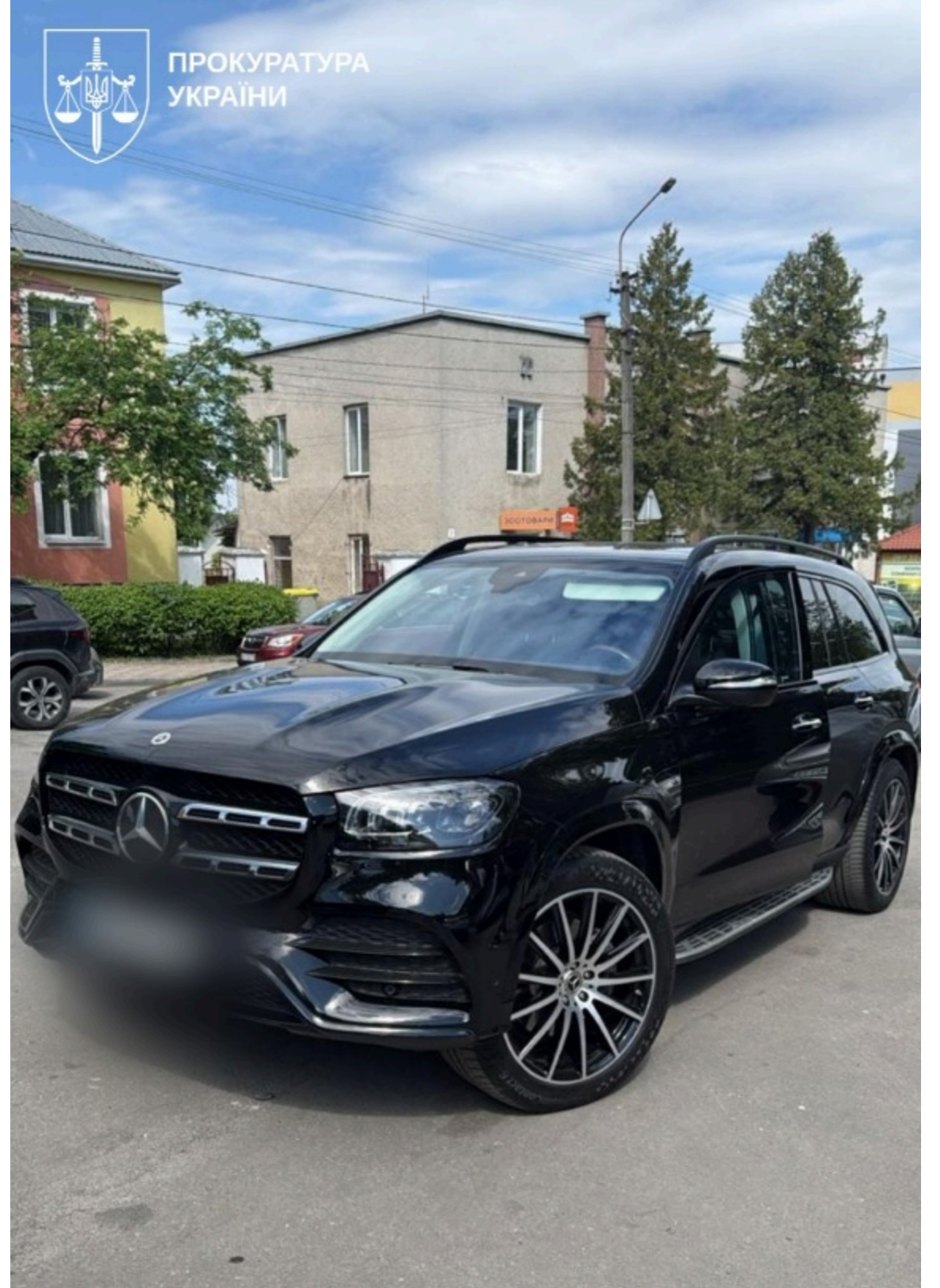
Шість авто, годинники та мільйони готівки: що знайшли у начальників поліції трьох областей

Посадовцям із трьох областей висунули підозру за частиною 4 статті 368 Кримінального кодексу України - одержання неправомірної вигоди в особливо великому розмірі службовою особою, яка займає відповідальне становище, вчиненого за попередньою змовою групою осіб.