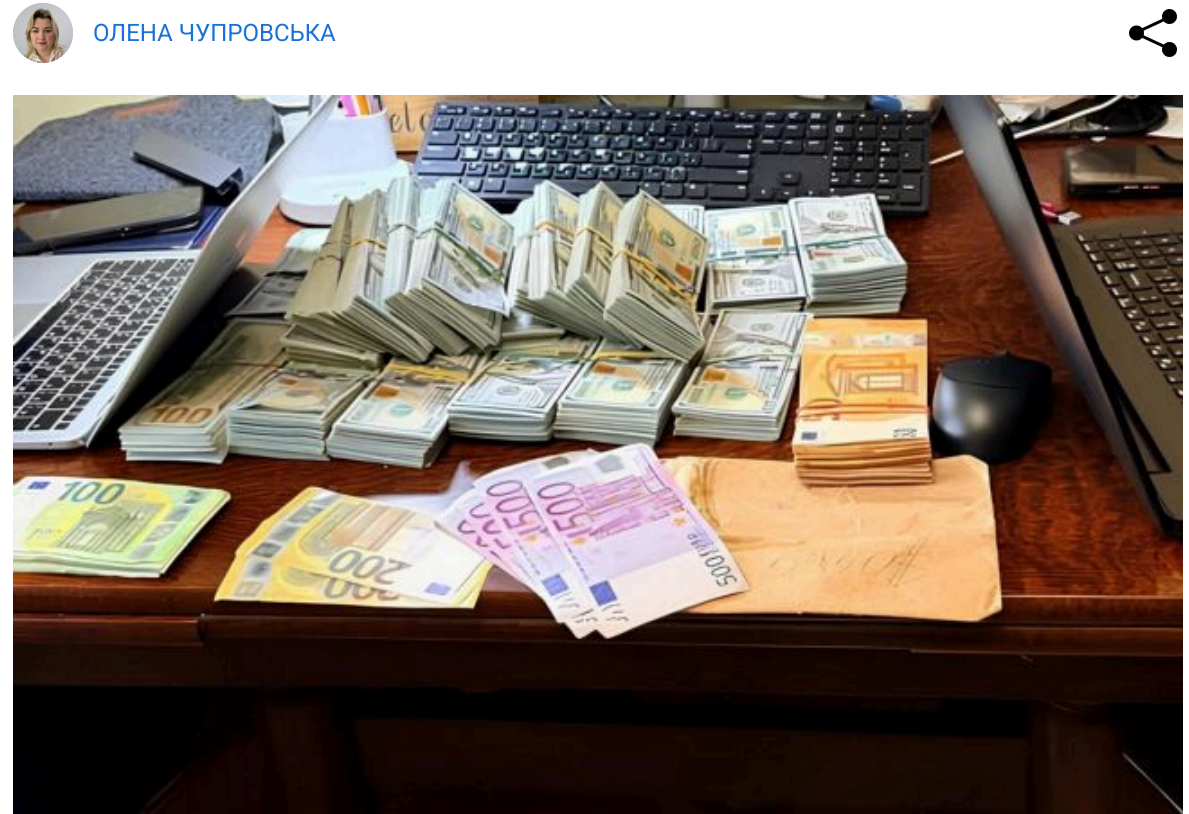
Фото: що вилучили у корумпованих керівників Нацполу

У посадовців Національної поліції вилучили шість елітних авто, зброю та понад 22 мільйони готівкою - це друга хвиля масштабної операції з очищення відомства.