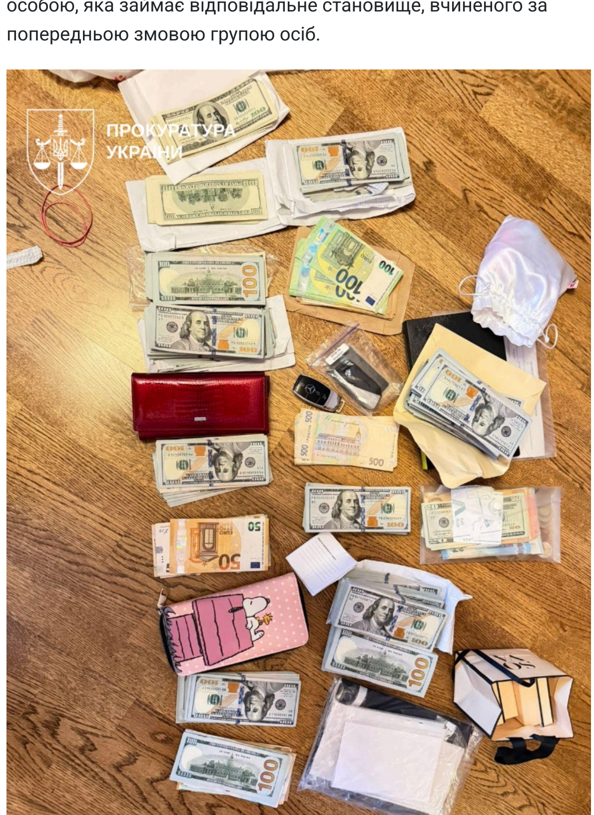
Фото: Операція з очищення Нацполу (facebook.com/RuslanKravchenkoKyiv)

Посадовцям із трьох областей висунули підозру за частиною 4 статті 368 Кримінального кодексу України - одержання неправомірної вигоди в особливо великому розмірі службовою особою, яка займає відповідальне становище, вчиненого за попередньою змовою групою осіб.