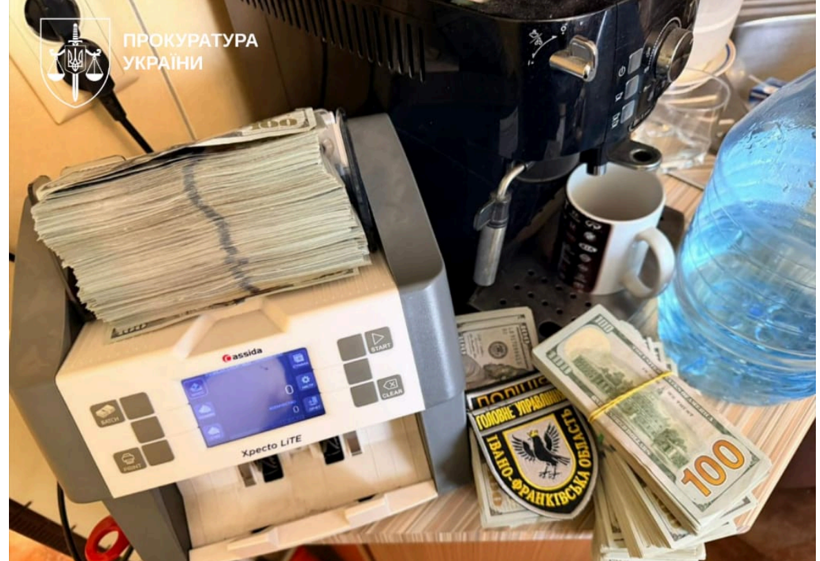
Фото: що вилучили у керівників Нацполу

Наразі затримані п'ятеро учасників схеми. Усім повідомили про підозру.