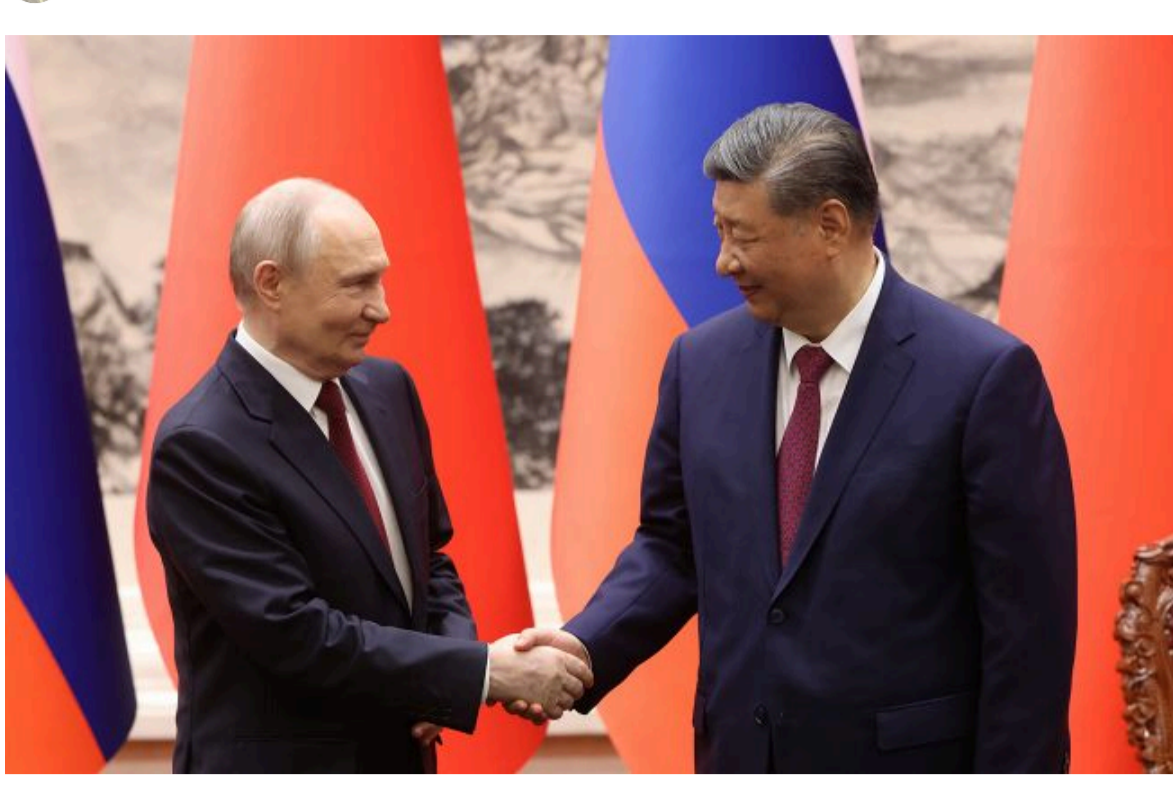
Фото: російський диктатор Володимир Путін і лідер Китаю Сі Цзіньпін під час зустрічі 20 травня