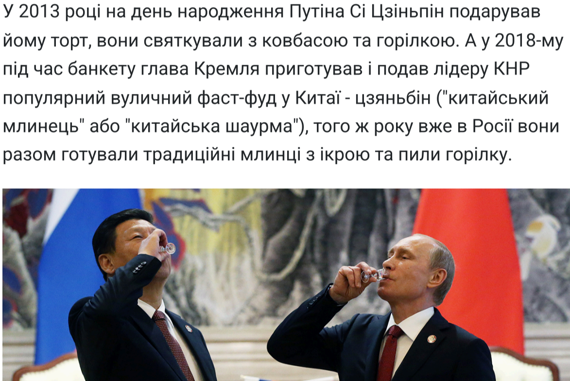
Фото: Сі Цзіньпін і Путін у 2013 році п'ють горілку на день народження російського диктатора

У 2013 році на день народження Путіна Сі Цзіньпін подарував йому торт, вони святкували з ковбасою та горілкою. А у 2018-му під час банкету глава Кремля приготував і подав лідеру КНР популярний влиничний фаст-фуд у Китаї - цзяньбін ("китайський млинець" або "китайська шаурма"), того ж року вже в Росії вони разом готували традиційні млинці з ікрою та пили горілку.