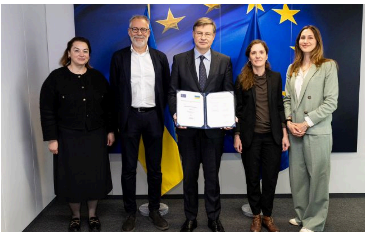
Фото: Єврокомісія підписала меморандум про допомогу Україні на 8,35 млрд євро