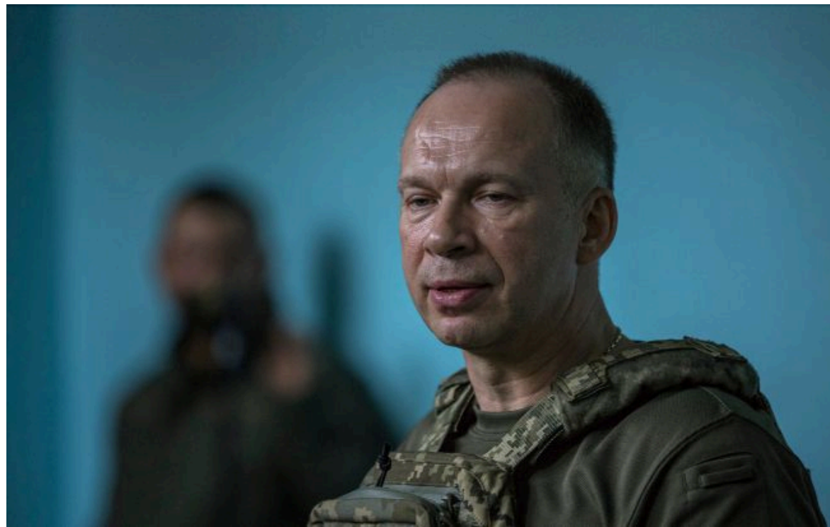
Фото: Олександр Сирський, головнокомандувач ЗСУ (Getty Images)