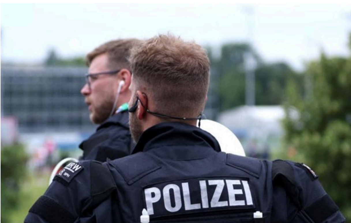
(ілюстративне фото) Підозрюваних затримали у Мюнхені

Подружжя підозрюють у зборі даних про технологічні інновації у Німеччині. Вони нібито цілеспрямовано вивідували таку інформацію у німецьких науковців.