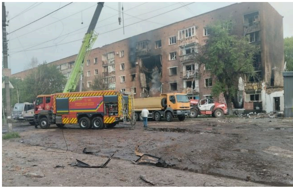
Фото: наслідки ворожого удару по Конотопу