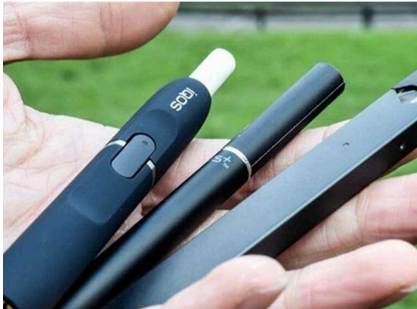
Куртка замість складу: у Вінниці засудили іноземця, який намагався вивезти рідину для вейпів у підкладці одягу

Вінницький міський суд виніс постанову у справі громадянина Молдови, який намагався вивезти з України підакцизний товар, перетворивши власний одяг на тайник. Спроба «тихо» вивезти китайську рідину для вейпів коштувала чоловіку подвійних витрат.