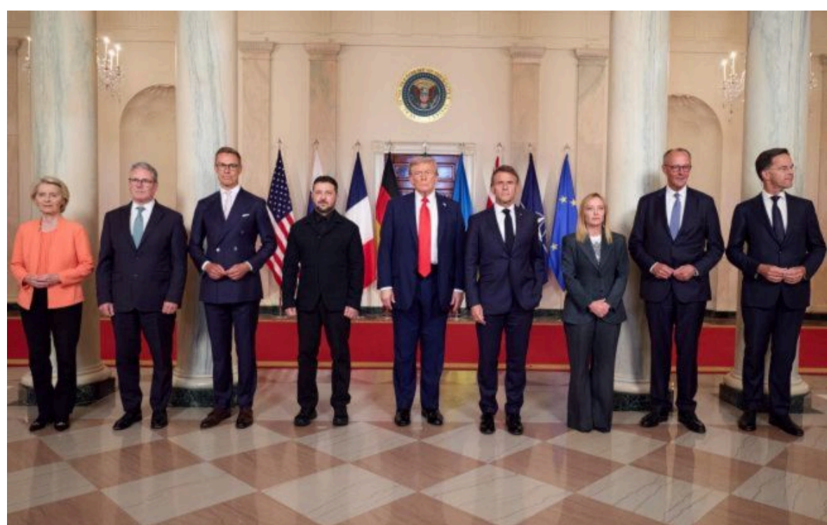
Фото: у ЄС наступного тижня обговорять, хто може стати переговорником з Росією

Не витрачай час на шум! Читай тільки суть з РБК-Україна у Google