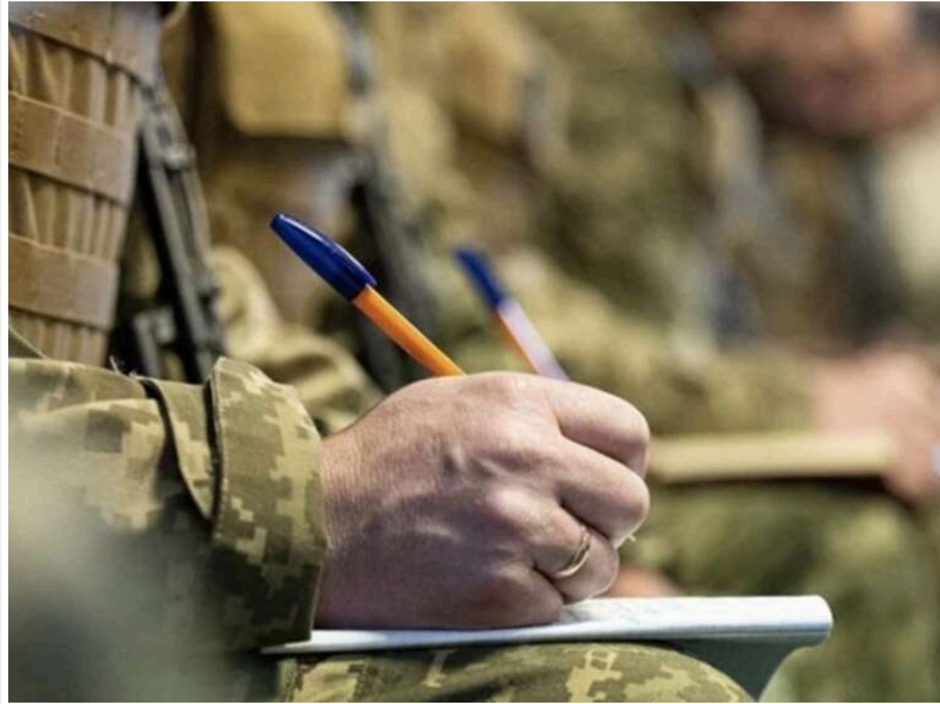
Смерть мобілізованого у підрозділі "Скеля": сестра заявляє про побиття, у полку кажуть про падіння з дерева

Мобілізований у підрозділ «Скеля» поскаржився на побиття, після чого помер. У військовій частині стверджують, що чоловік намагався покінчити з собою, а потім упав з дерева, намагаючись самовільно покинути розташування частини.