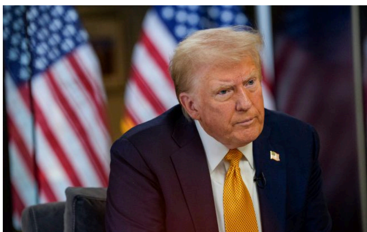
Фото: президент США Дональд Трамп (Getty Images)