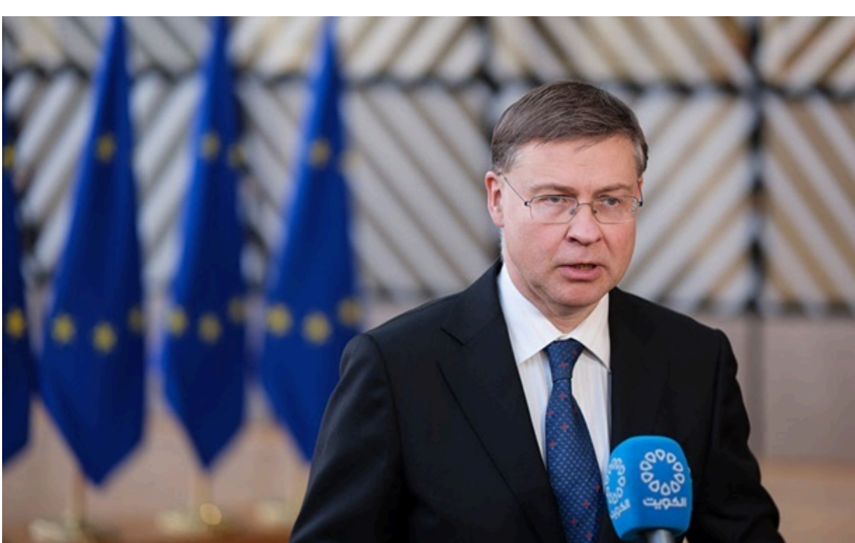
Європейський комісар з питань економіки Валдіс Домбровскіс

Українська сторона має ратифікувати меморандум у Верховній Раді, перш ніж кошти будуть виплачені.