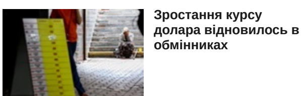
Зростання курсу долара відновилося в обмінниках

Долар стабілізувався у обмінниках, євро падає Офіційний курс долара стабілізувався, євро падає Гривня втрачає позиції в обмінниках Долар йде вгору в обмінниках, євро дешевшає