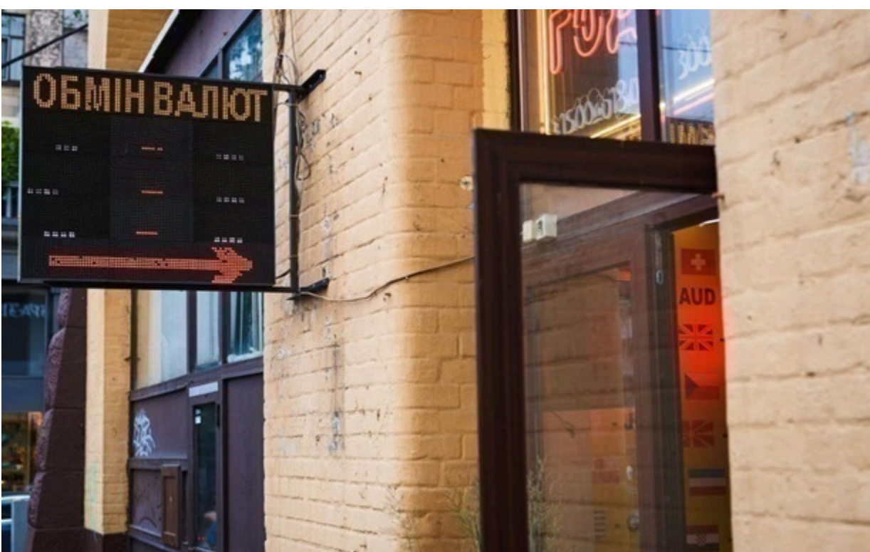
Обмінники купують долар у середньому по 43,90 гривні

Середній курс продажу долара залишився на рівні 43,98 гривні, а курс продажу євро впав до 51,60 гривень.