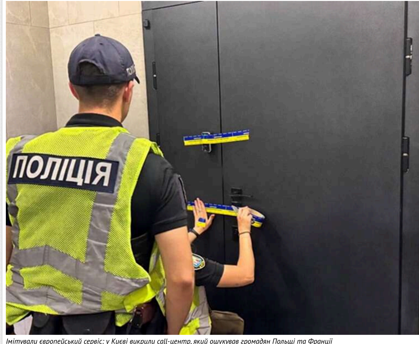
Імітували європейський сервіс: у Києві викрили call-центр, який ошукував громадян Польщі та Франції

«Таргет — $700 000»: у київському Wave Tower викрили міжнародний scam-офіс. 13 поверх бізнес-центру Wave Tower на проспекті Степана Бандери. У середині — класичний call-центр із десятками операторів, бордами КРІ, комп'ютерами та навіть гоном для святкування успішного розводу людей на гроші.