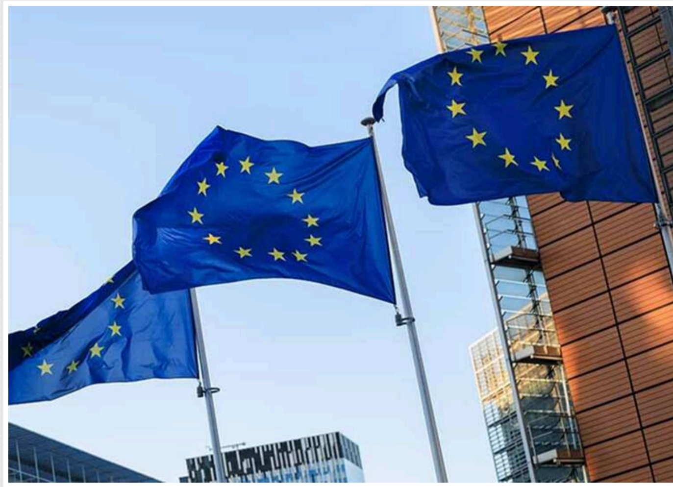
Європа шукає переговорника з РФ щодо України: FT назвала нове ім'я та реакцію Трампа

Міністри закордонних справ ЄС наступного тижня на Кіпрі обговорять можливу кандидатуру переговорника з Росією щодо українського питання, пише Financial Times.