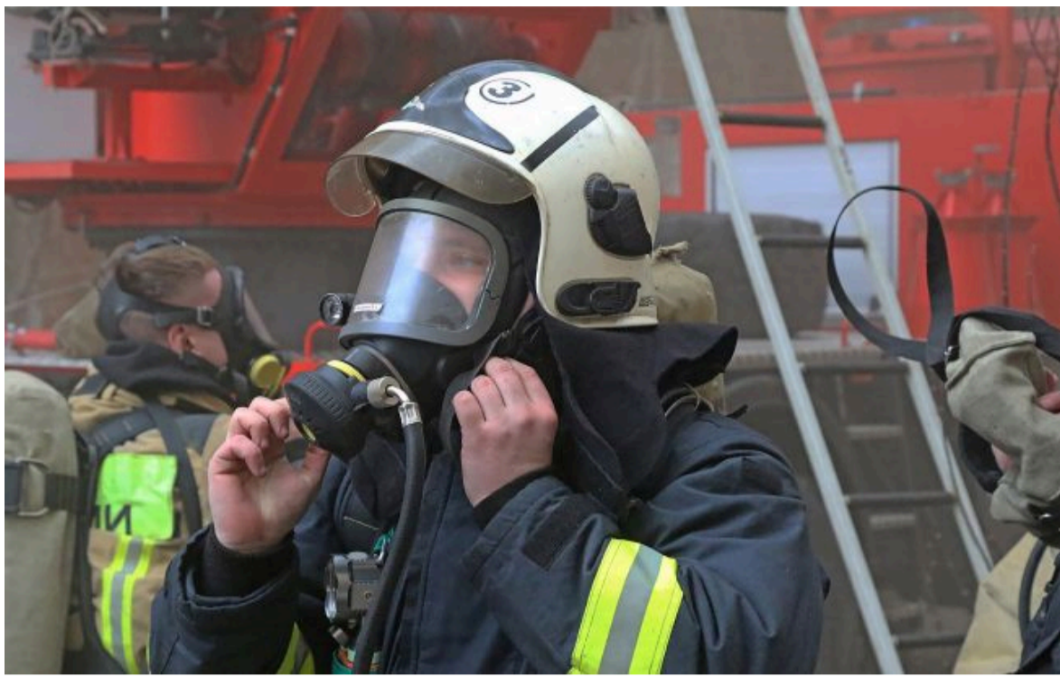
Фото ілюстративне: Сили оборони повторно уразили російський НПЗ у Кстово (t.me GUmchs62)

Розумій ситуацію на фронті через факти, а не чутки з РБК-Україна у Google