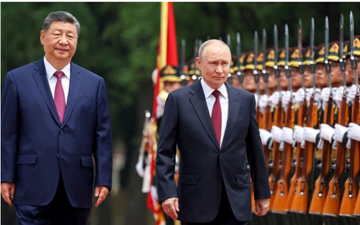
Сі Цзінпін і Володимир Путін зустрілися у Пекіні

Китай і Росія "захищають міжнародну справедливість" у сучасному світі, наголосив лідер КНР.