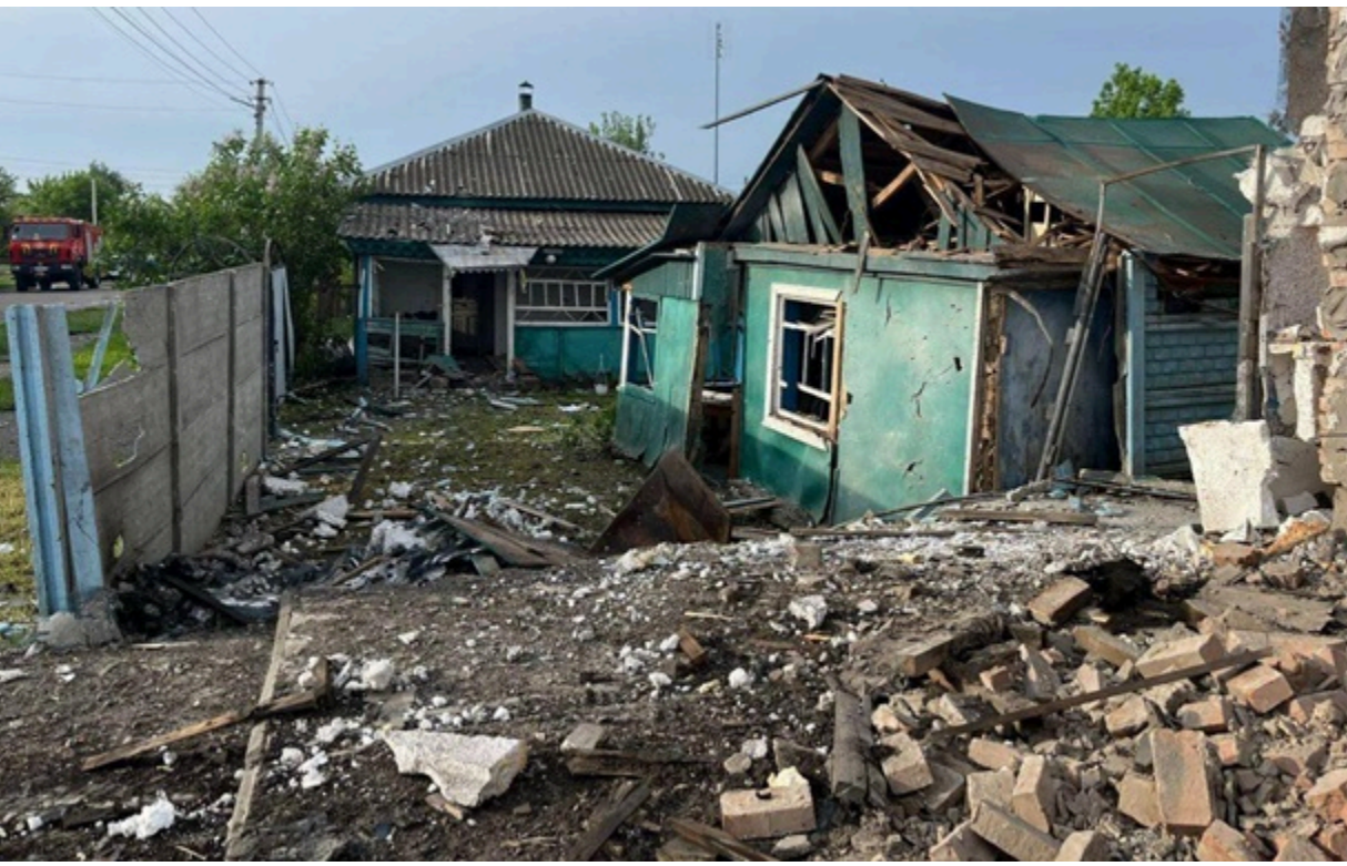
Наслідки російської атаки на Чернігівщину

Внаслідок російської атаки загинуло четверо людей - двоє чоловіків, жінка і 15-річний хлопець. 30 людей постраждали.