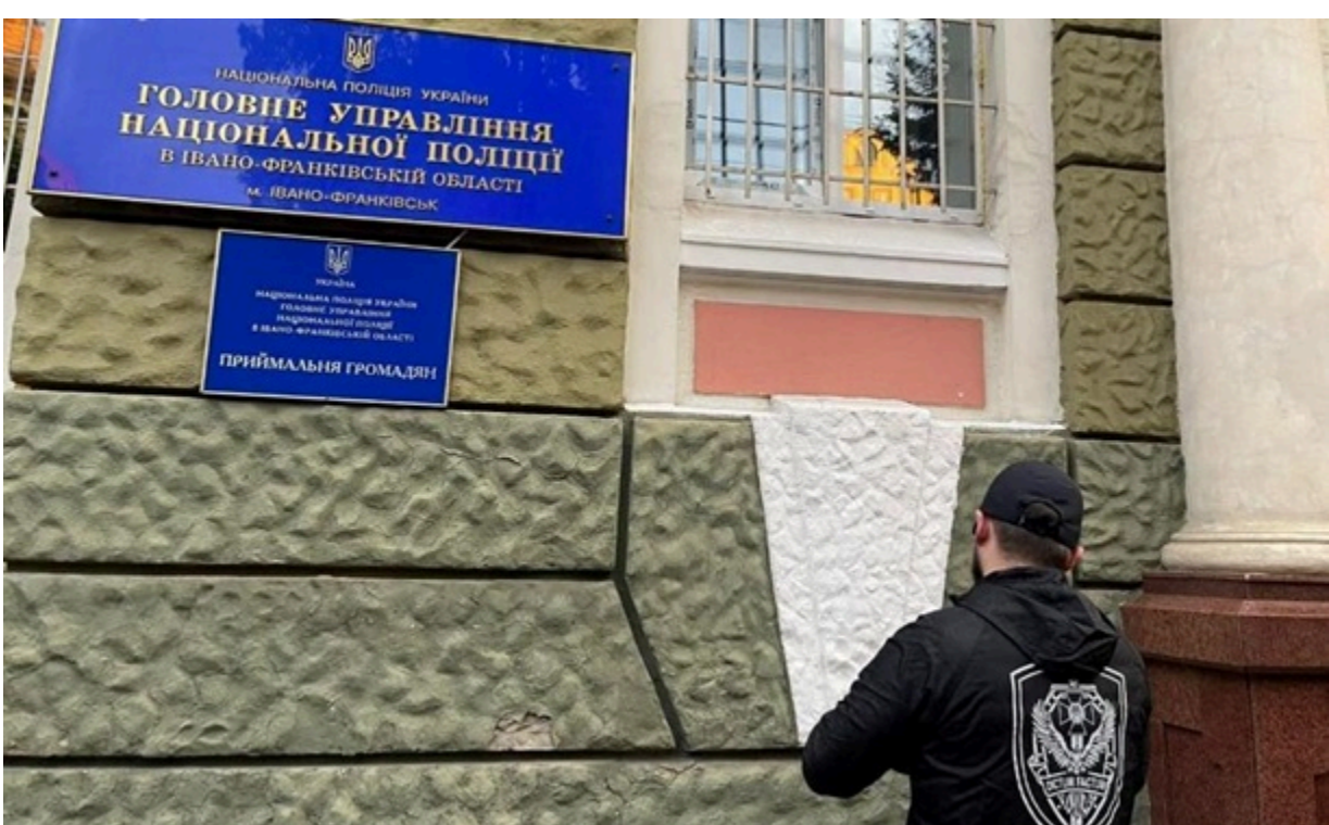
Фото: Офіс генпрокурора. Затримано начальника ГУНП в Івано-Франківській області

Фігуранти займалися "кришуванням" діяльності моделей в інтернет-платформах із відвертим контентом.