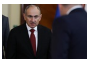
РФ розгорнула масштабну кампанію проти Пашиняна: ЗМІ дізналися "кураторів"

Два супертанкери Китаю пройшли Ормузьку протокою