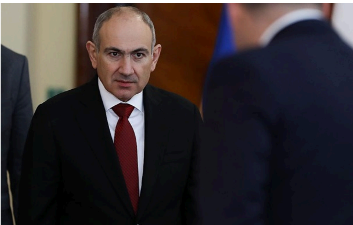
Росія намагається сунути Нікола Пашиняна від влади у Вірменії

Росія веде інформаційну кампанію проти прем'єра Вірменії. Її координує управління президента РФ зі стратегічного партнерства та співробітництва.