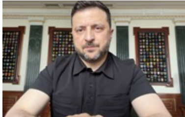
Зеленський піджував прем'єру Угорщини за ослу РФ 14 травня 2026, 00:25