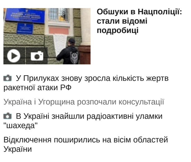
Обшухи в Нацполіції: стали відомі подробиці

У Прилуках знову зросла кількість жертв ракетної атаки РФ Україна і Угорщина розпочали консультації