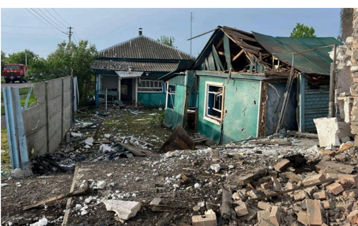
Наслідки російської атаки на Чернівецьщину

Внаслідок російської атаки загинуло четверо людей - двоє чоловіків, жінка і 15-річний хлопець. 30 людей постраждали.