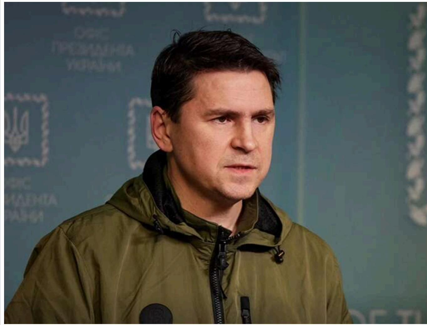
Подоляк назвав умову та терміни проведення виборів в Україні

Вибори в Україні можуть відбутися навесні 2027 року, якщо Росія погодиться завершити війну по лінії фронту, заявив радник ОП Михайло Подоляк.