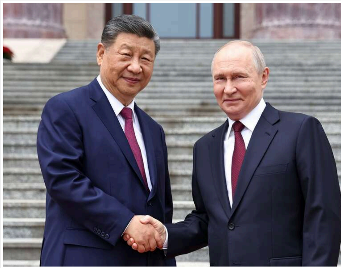
"Усунення першопричин": Росія та Китай у спільній заяві згадали Україну та закликали до переговорів

У спільній заяві РФ і КНР за підсумками переговорів Путіна і Сі згадується ситуація в Україні.