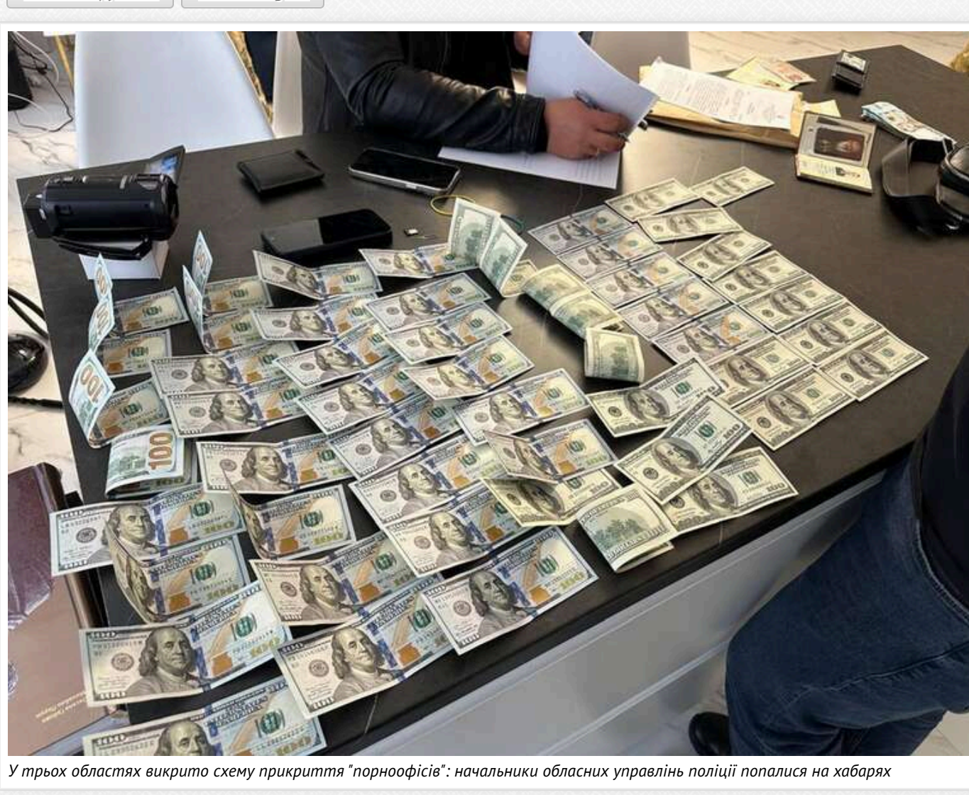
У трьох областях викрито схему прикриття "pornoофісів": начальники обласних управлінь поліції попалися на хабарях

Серед затриманих – високопосадовці Національної поліції: в трьох областях викрили схему прикриття «pornoофісів».