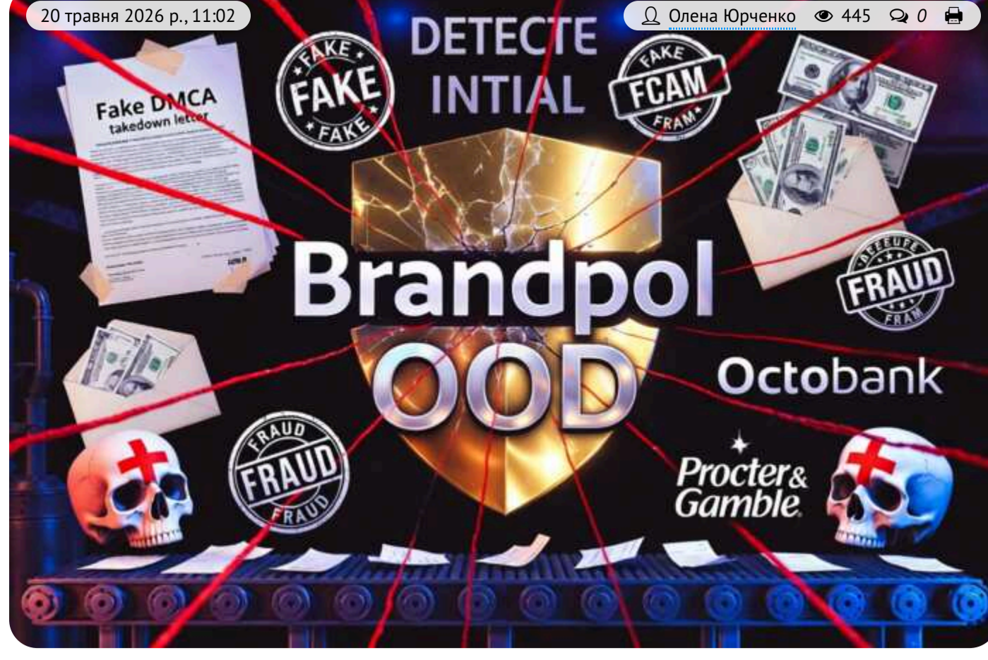
Brandpol OOD – фабрика російського скаму та цифрового рекету під виглядом «захисту репутації»

На сайті Brandpol OOD усе виглядає солідно та презентабельно: міжнародна команда, захист бренду, боротьба з фішингом, моніторинг маркетплейсів, видалення небажаного контенту та робота в 170 країнах світу.