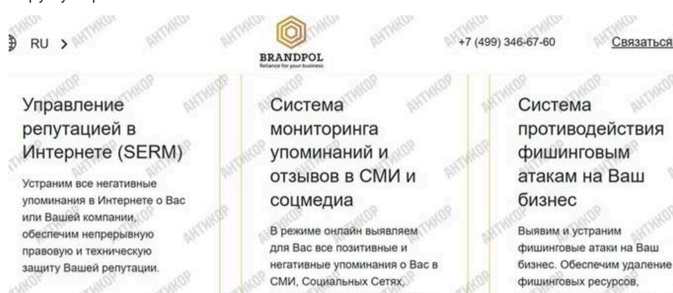
Brandpol OOD – фабрика російського скаму та цифрового рекету під виглядом «захисту репутації»

Формально Brandpol OOD працює у сферах IP protection, anti-phishing, takedown services та «репутаційного захисту». На своєму сайті компанія прямо обіцяє «усунути негативні згадки», «захистити репутацію» та «видалити контент, що порушує права».