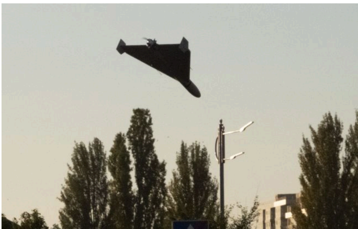
Фото у Литві оголосили повітряну тривогу та підняли винищувачі через дрон із Білорусі