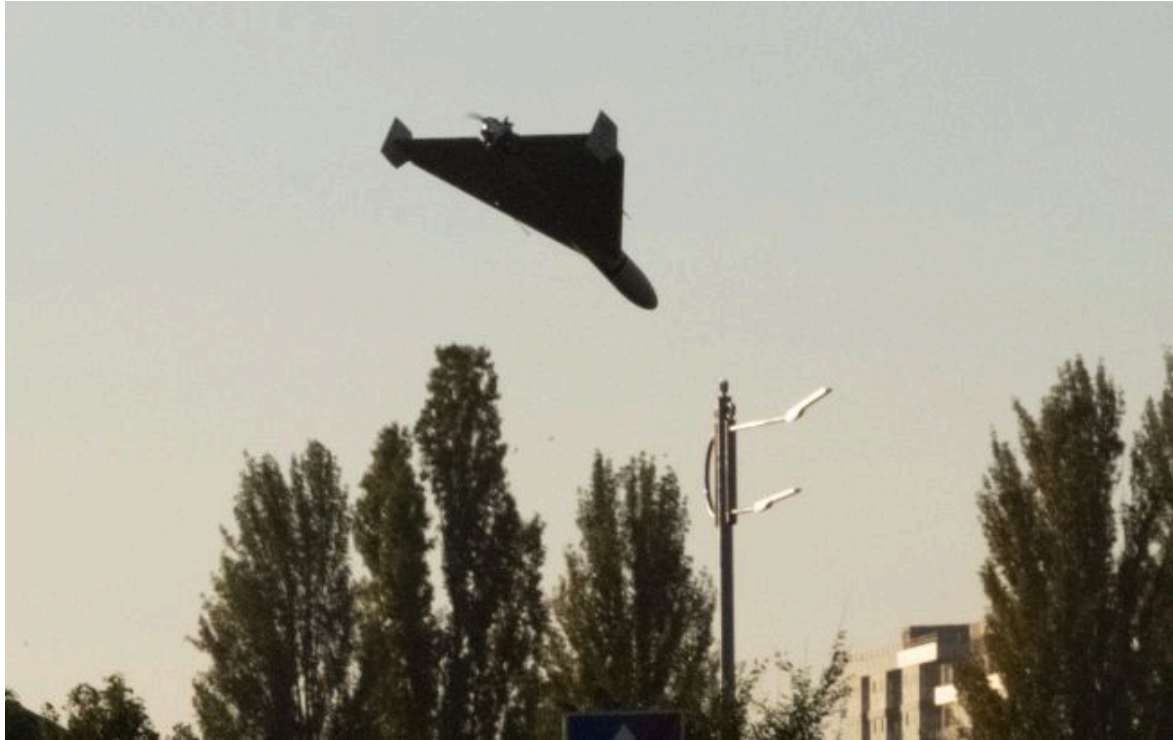
Фото у Литві оголосили повітряну тривогу та підняли винищувачі через дрон із Білорусі