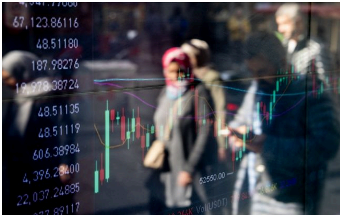
Ринок рухається до токенизації людського потенціалу

Не витрачай час на шум! Читай тільки суть з РБК-Україна у Google