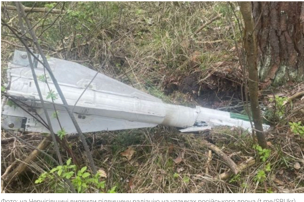
Фото: на Чернігівщині виявили підвищену радіацію на уламках російського дрона (T.me/SBUkr)

Розумій ситуацію на фронті через факти, а не чутки з РБК-Україна у Google