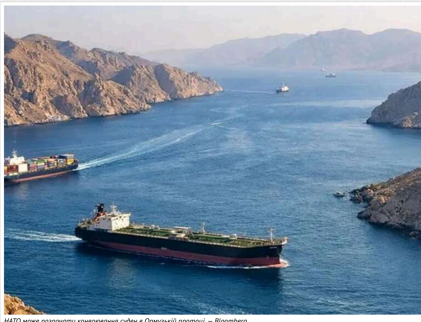
НАТО може розпочати конвоювання суден в Ормузькій протоці, – Bloomberg

НАТО обговорює захист цивільних кораблів в Ормузькій протоці – Bloomberg.