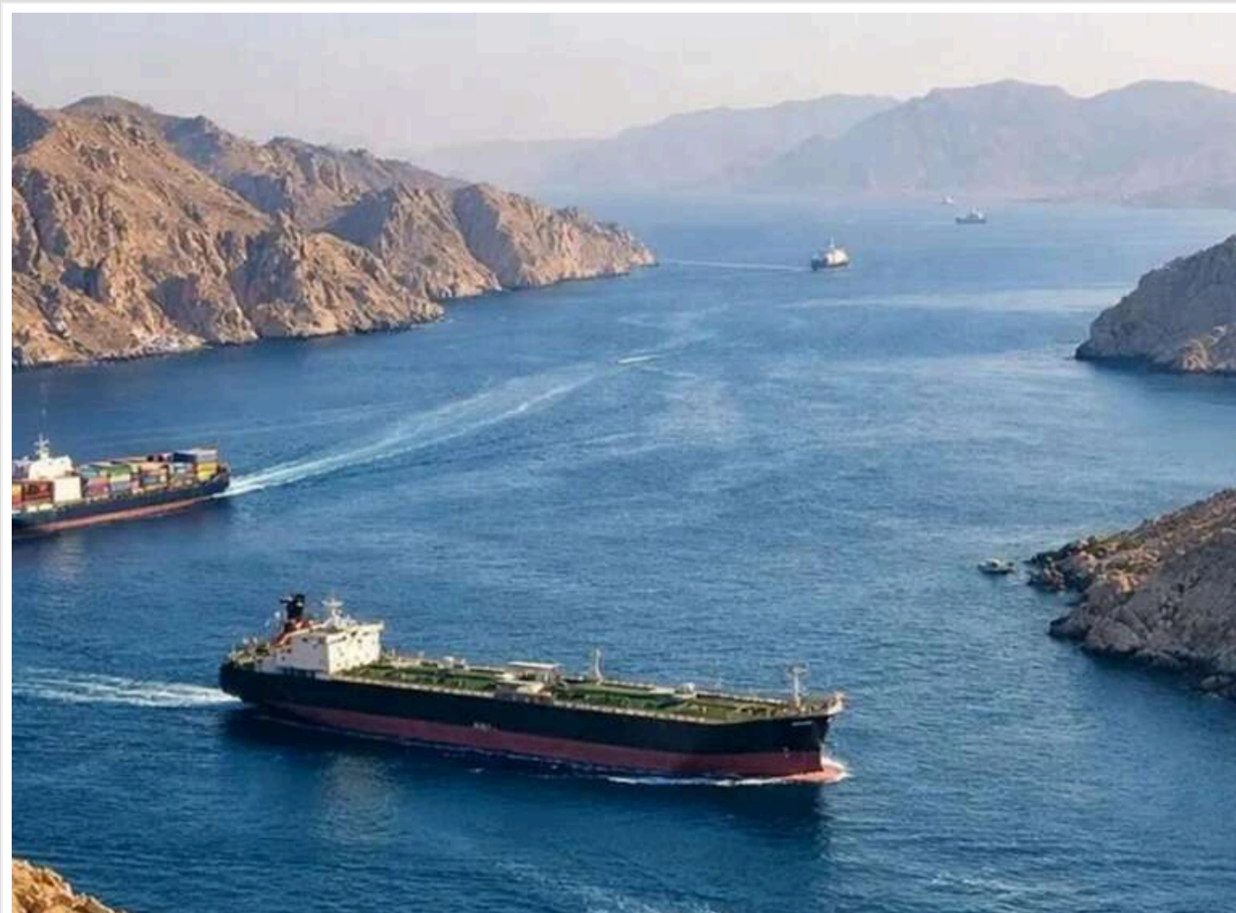
НАТО може розпочати конвоювання суден в Ормузькій протоці, – Bloomberg

НАТО обговорює захист цивільних кораблів в Ормузькій протоці, – Bloomberg.