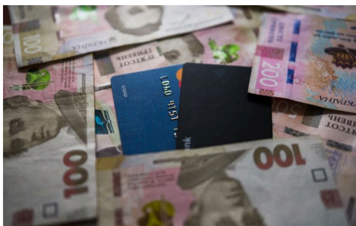
Фото: експерт пояснив, який кредит безпечніший для щоденних витрат (РБК-Україна)

Не витрачай час на шум! Читай тільки суть з РБК-Україна у Google