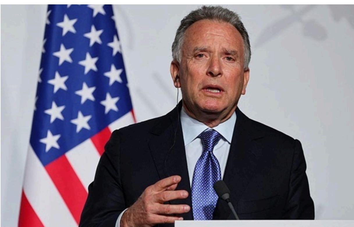
Спецпосланець президента США Стів Віткофф

У Москві оголосили про візит спецпосланця президента Сполучених Штатів Стіва Віткоффа до Росії.