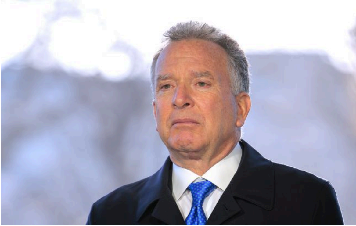
Фото: Стів Віткофф (Getty Images)