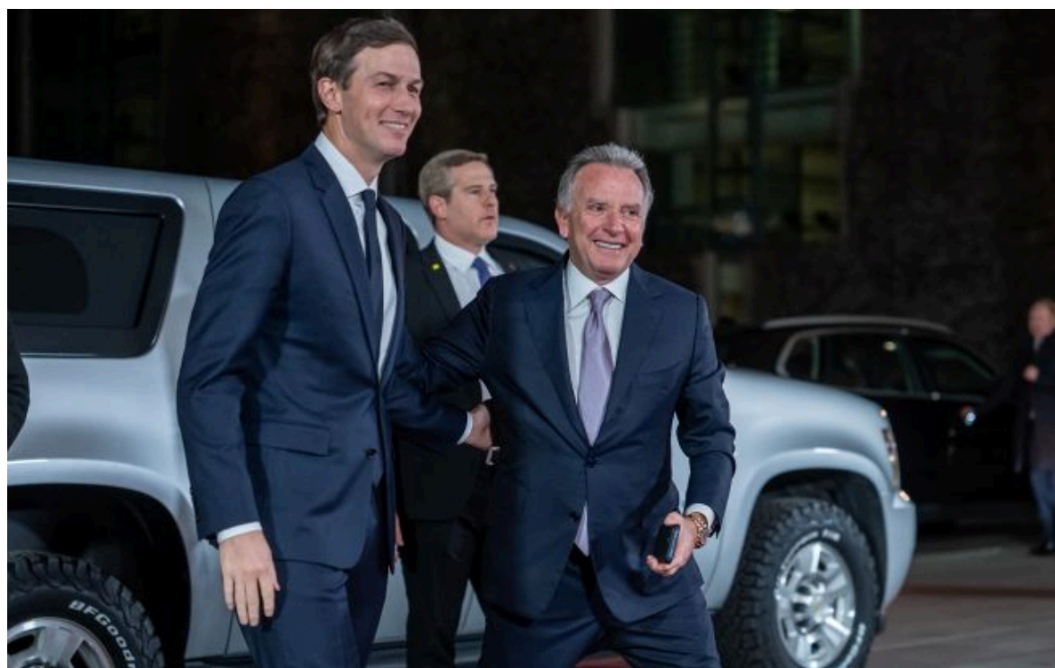
Фото: Стив Віткофф та Джаред Кушнер