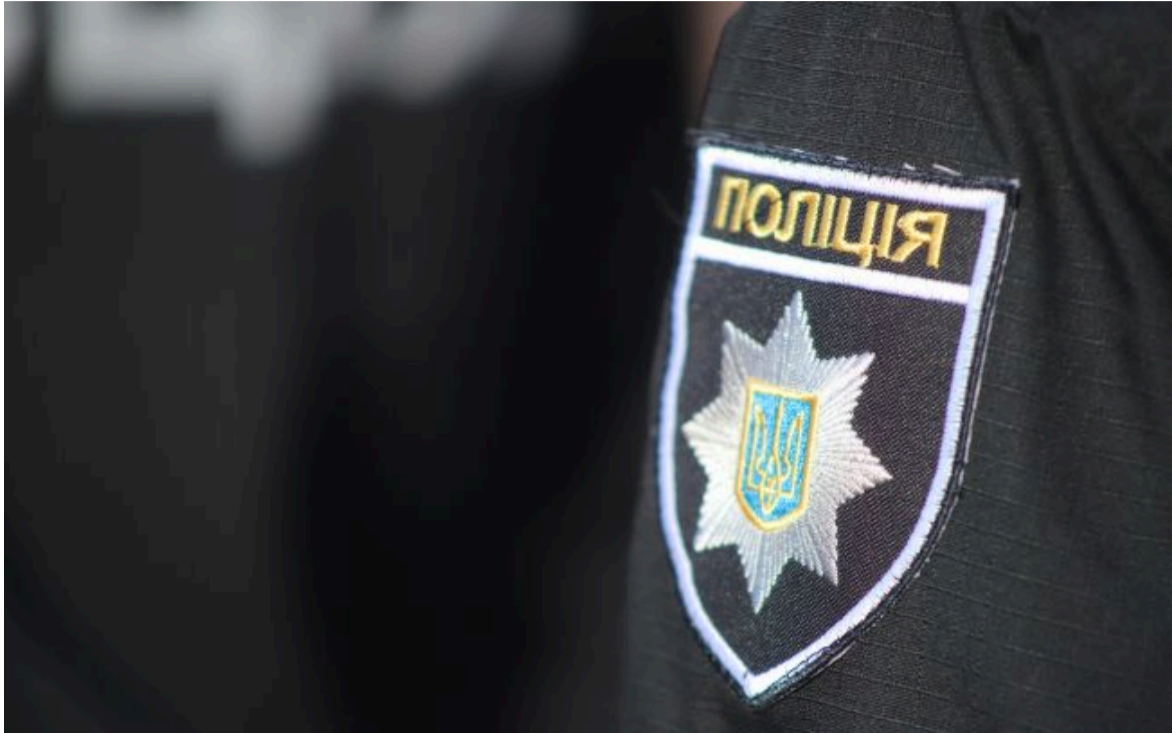
Фото: що відомо про обшуки в управліннях Нацполу