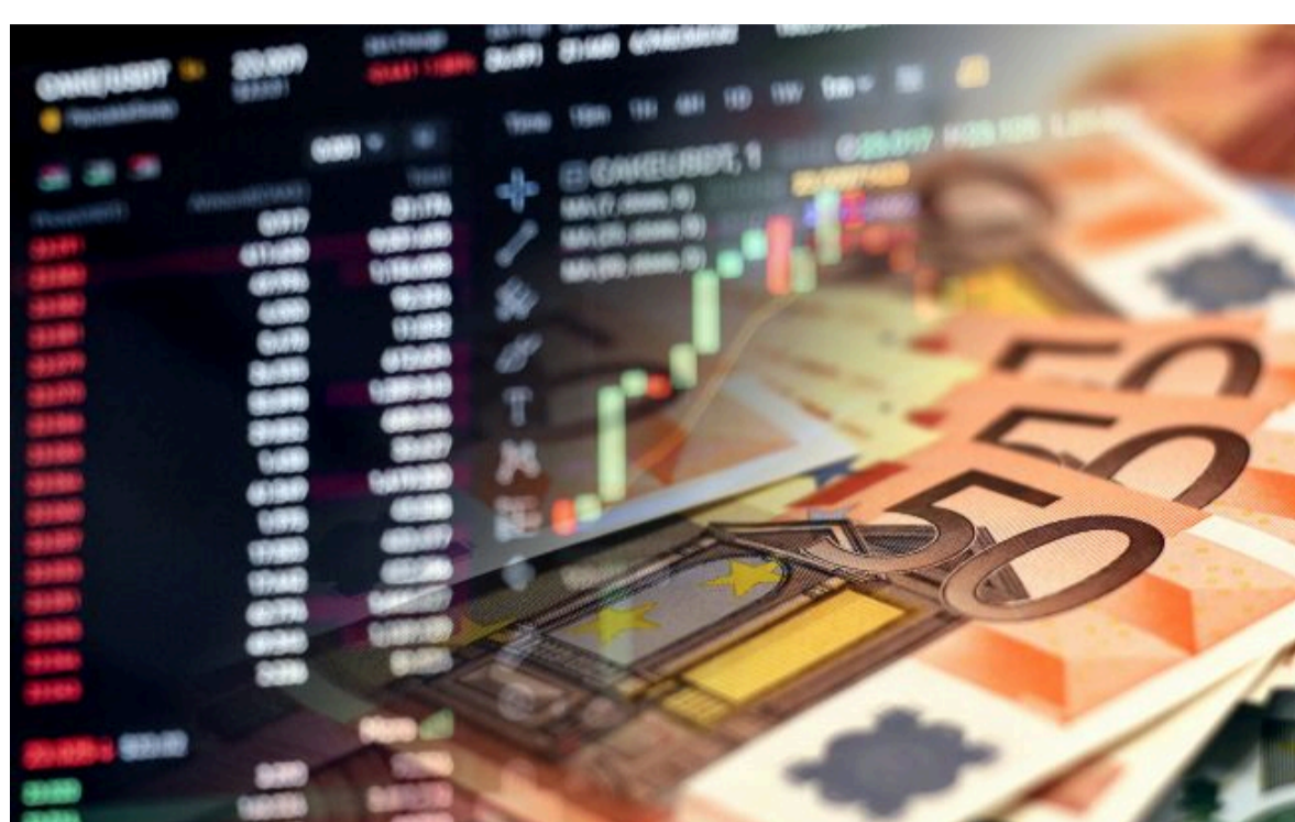
Фото: обмінники та банки оновили курс валют