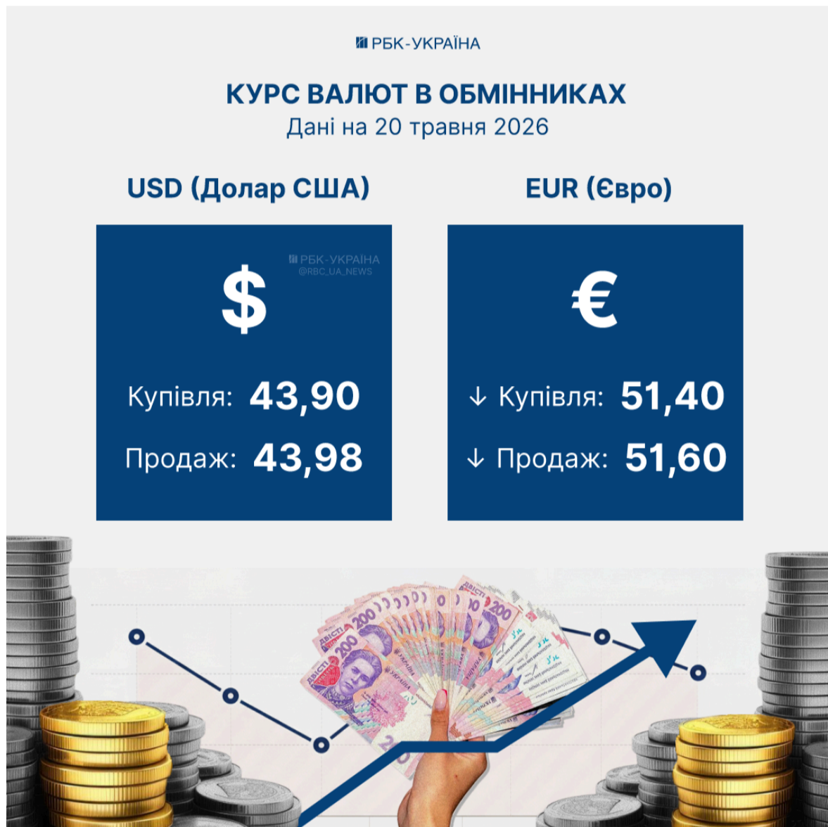
Фото: курс валют на 20 травня (інфографіка РБК-Україна)

Євро в обмінниках сьогодні можна купити за середнім курсом у 51,60 (-10 коп) гривень, а здати - по 51,40 (-10 коп) гривень.