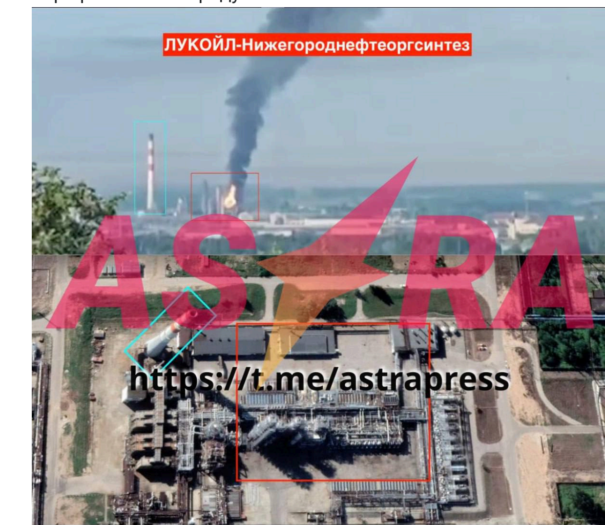
Фото: Дрони вдарили по заводу Лукойлу - що горить у Кстові (t.me/astrapress)

Удар по хімічному комбінату на Ставрополілі