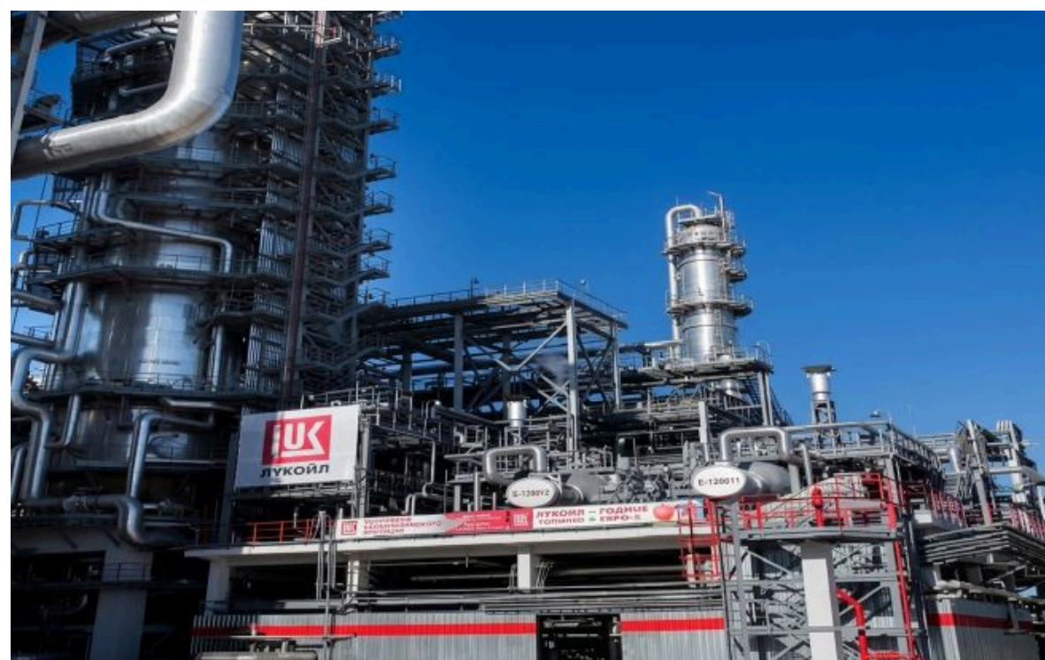
Фото: Горить один із найбільших НПЗ Росії

Розумій ситуацію на фронті через факти, а не чутки з РБК-Україна у Google