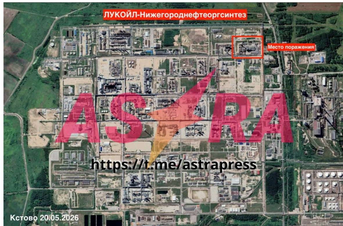
Фото: наслідки атаки на НПЗ (t.me/astrapress)

Місцева влада через атаку перевела школярів Кстовського району на дистанційне навчання і рекомендувала не відправляти дітей до дитячих садків.