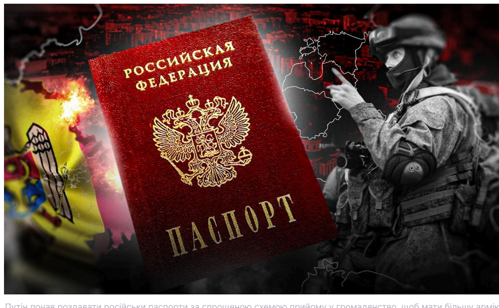
Путін почав роздавати російські паспорти за спрощеною схемою прийому у громадянство, щоб мати більшу армію