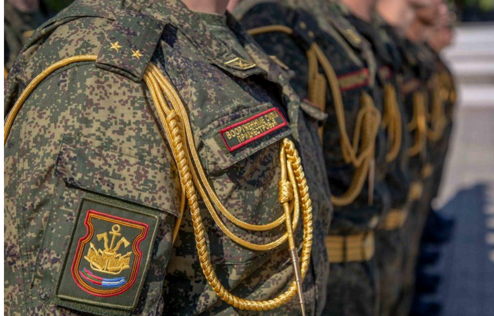
Москві потрібні люди для війни, і вона шукатиме їх, у тому числі, у невизнаному Придністров'ї