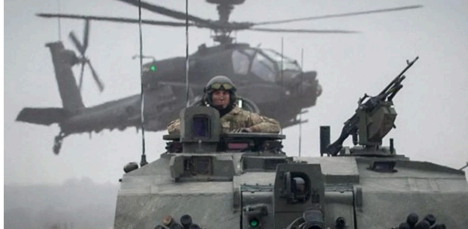
Естонія, як країна НАТО, проводить регулярні військові навчання, тримаючи армію напалогою

Концентрація "російських громадян" в цих країнах настільки висока, що це – ідеальне тло для провокацій. Коли організувати інцидент із "постраждалими" від переслідування місцевою владою/правоохоронцями громадянином РФ – лише питання техніки.