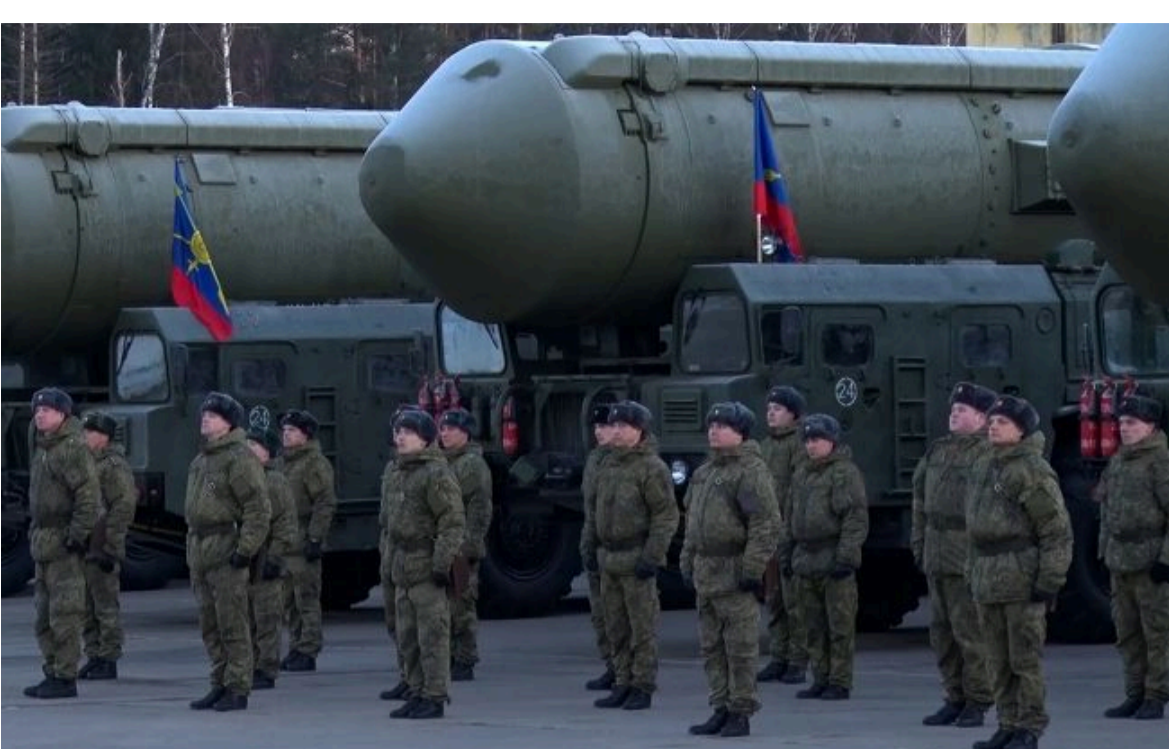
Фото: РФ спільно з Білоруссю розпочала ядерні навчання (Getty Images)

Вимкни хаос міжнародних новин! Отримуй тільки важливе з РБК-Україна у Google