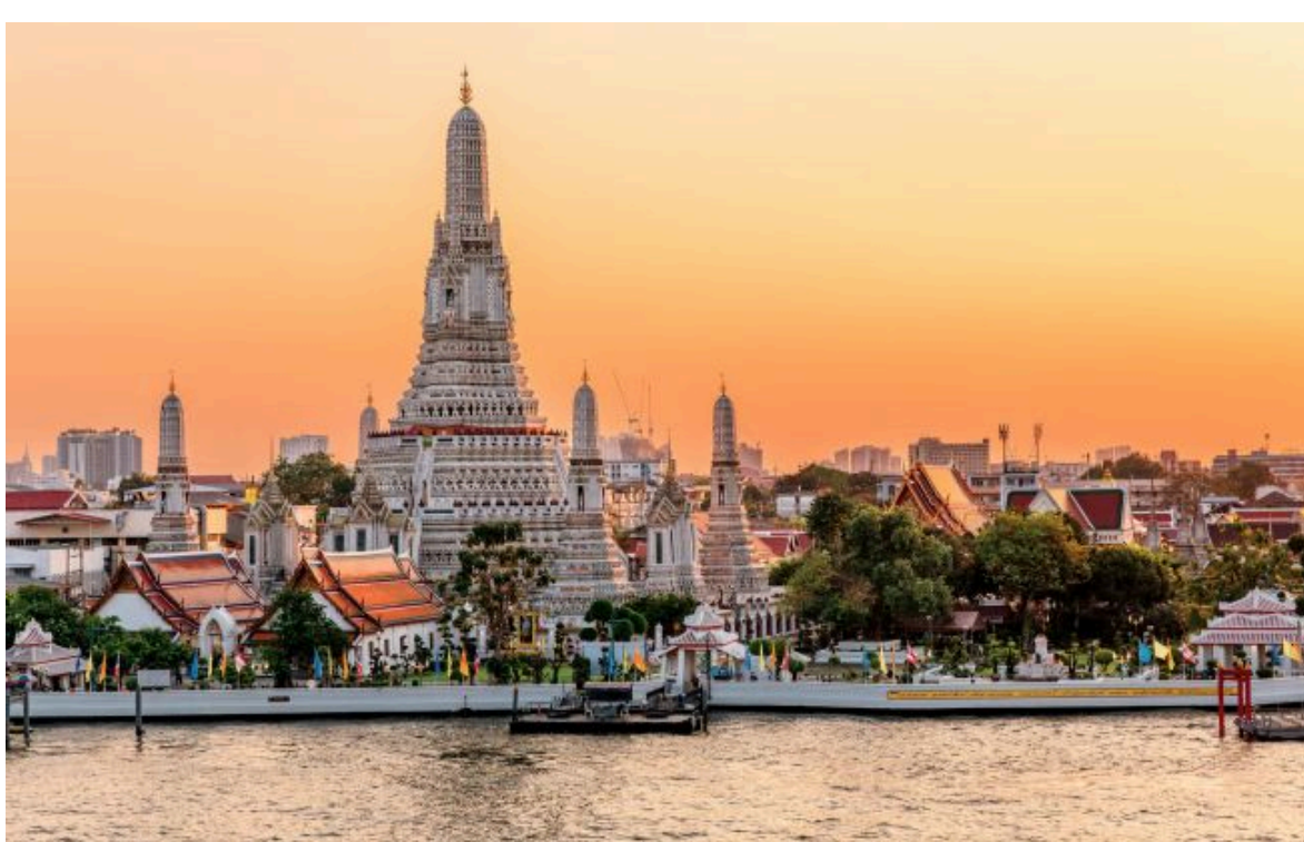
Фото: храм Ват Арун (Храм Саїтанку) у Бангкоку, Таїланд