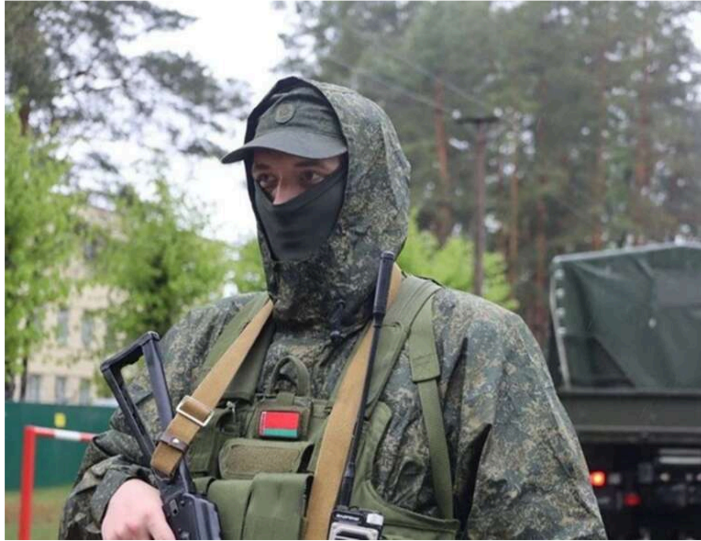
Ядерний шантаж і спроба приховати провали на фронті: в ISW назвали причини раптових стратегічних навчань Росії

Росія 19–21 травня проводить стратегічні навчання з використання ядерної зброї «у відповідь на загрозу агресії». Кремль почав їх, щоб продемонструвати силу союзникам України й таким чином натиснути на них.