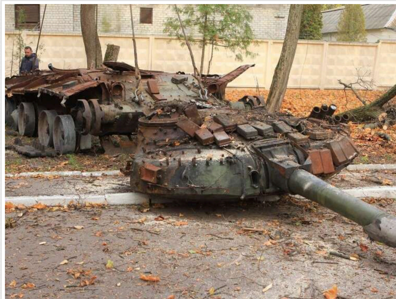
Втрати ворога за добу: ЗСУ знешкодили 920 окупантів і 3 танки

Сили оборони України за минулу добу зменшили чисельність російської окупаційної армії на 920 військовослужбовців. Загальні втрати Росії у живій силі сягнули 1 352 070 осіб.