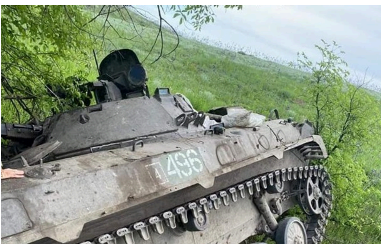
Армія Росії втратила в Україні 1 352 070 військових

Минулої доби ЗСУ ліквідували 920 окупантів. Знищено три танки, дві бронемашини, 60 артсистем, три РСЗВ, два засоби ППО, шість НРК, 1873 БлЛА.