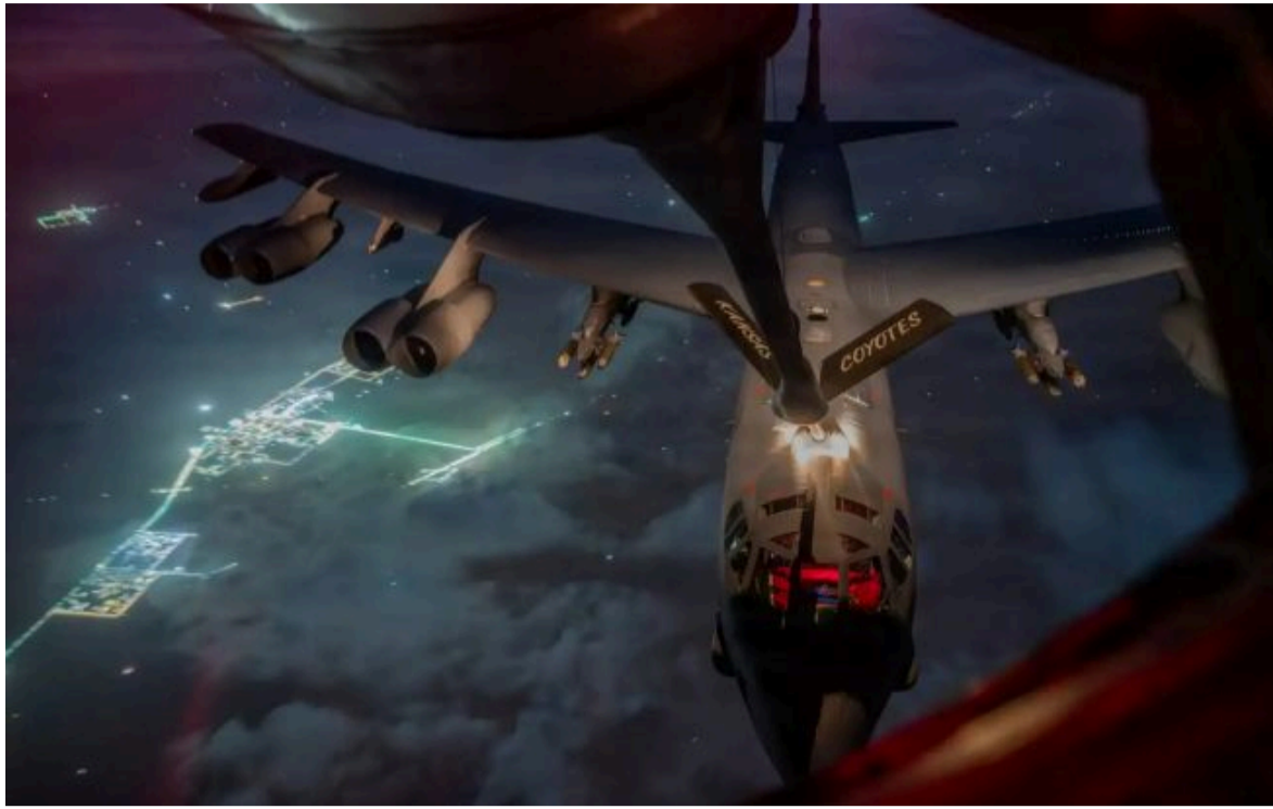
Фото: дозаправлення літака США у повітрі під час операції в Ірані